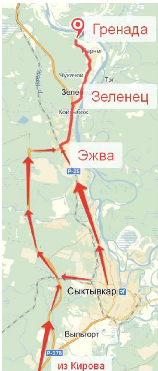
Схема проезда на личном транспорте: